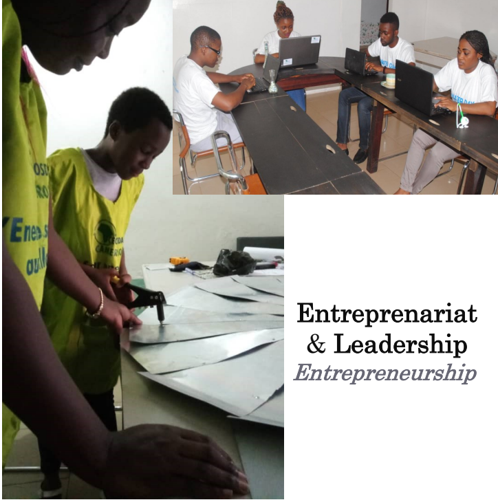
Entreprenariat & Leadership Entrepreneurship

MESURES ANTI-COVID-19 ⇒Le centre est désinfecté tous les jours ⇒Pas plus de 10 personnes pour les activités pratiques ⇒Des lecteurs MP3 individuels sont utilisés pour les exercices vocaux