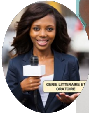
Génie littéraire et art oratoire/ Arts and Public Speaking