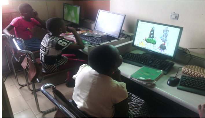
Informatique / Computer skills